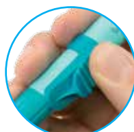
Aufsatz für den Auslöseknopf

Autopen® Zubehör ermöglicht eine noch einfachere Injektion für Menschen mit eingeschränkter Motorik.