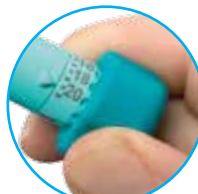
Aufsatz für die Dosierauswahl